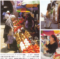
すべてサンクリストバル・デ・ラスカサス撮影。上-右下: 民族衣装を纏った先住民が集う屋外マーケット。右上: コロニアム様式の建物が並ぶ、美しい街並み。看板類が景観を損ねないよう配慮されている。